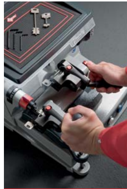
Fuidez control carro

La fresa, de HSS resistente, alcanza una velocidad de 650 r.p.m y se ha