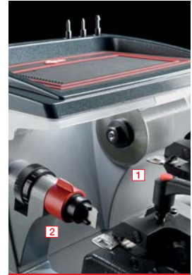
1 Fresa de HSS 2 Palpador de resorte

El soporte portaobjetos integrado en la máquina es sumamente amplio, sirve de apoyo para los accesorios y llaves, incluso las más largas, de manera ordenada y cómoda. Con el soporte porta-útiles destinado a las contrapuntas de llaves hembra se encuentra rápida e inmediatamente el accesorio adecuado. El plano inclinado facilita la evacuación directa de