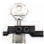
Mordaza para llaves a bomba

Numerosos los adaptadores opcionales, proyectados para poder usar con sencillez y colocar rápidamente llaves de tipologías distintas