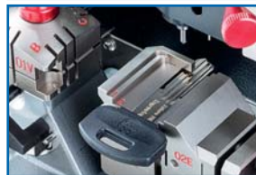
Área de grabado 3