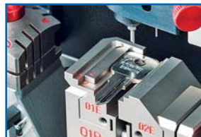
Área de grabado 4