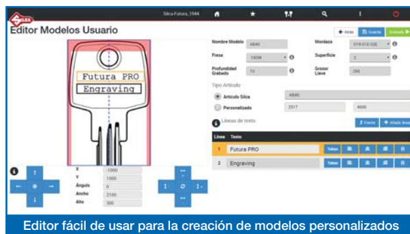
Editor fácil de usar para la creación de modelos personalizados