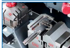
Área de grabado 2